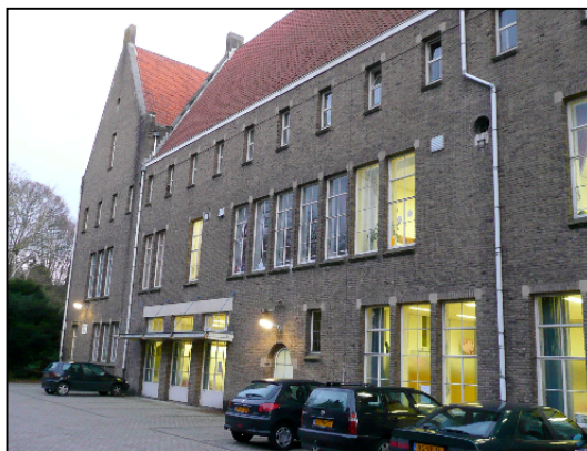
Figuur 1: Het gebouw van "De Kampanje"

De school richt zich op kinderen tussen de 4 en 18 jaren oud.